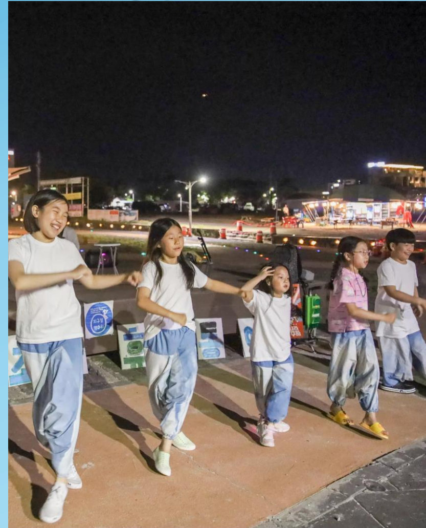
20240819 Busking at Gwakji Beach