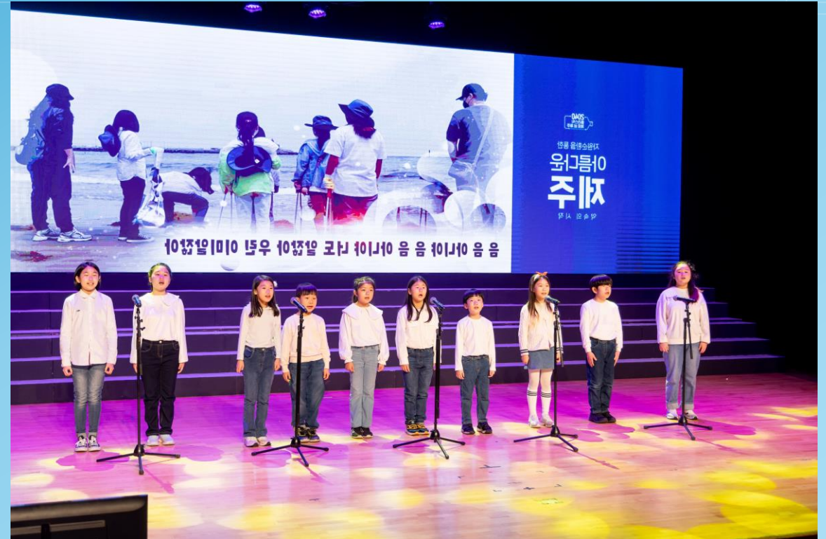
2023. Kick-off ceremony of the 2040PZI committee hosted by Jeju Special Self-Governing Province