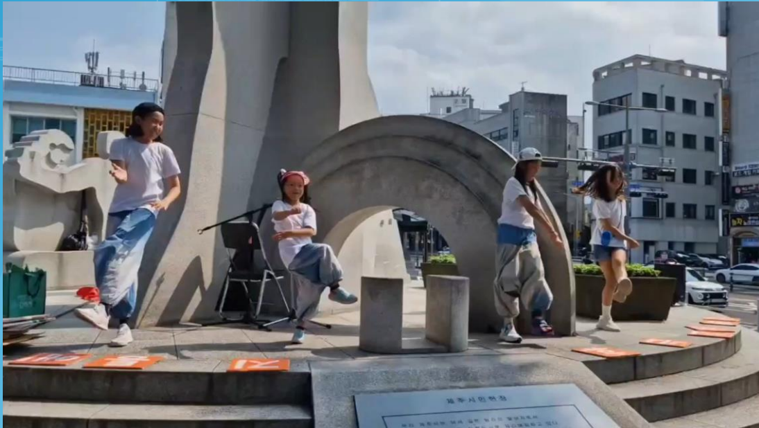
2024.907 Flash mob in front of Jeju City Hall

Turn eco-friendly practices into enjoyable culture