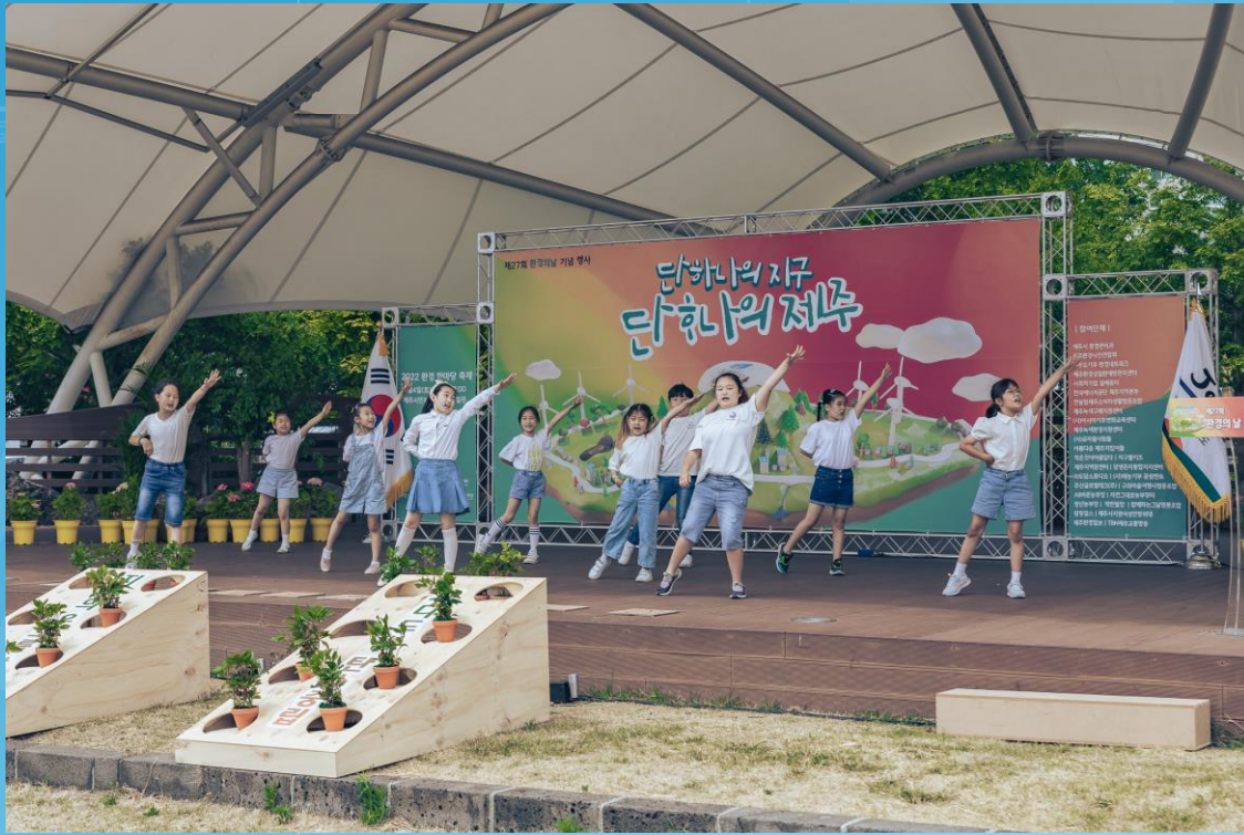
2022. Environmental day ceremony hosted by Jeju Special Self-Governing Province